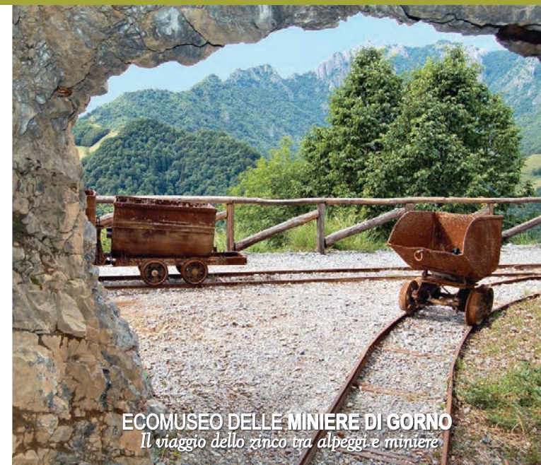
ECOMUSEO DELLE MINIERE DI GORNO Il viaggio dello zinco tra alpeggi e miniere